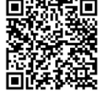
สื่อการสอน