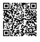
สื่อการสอน